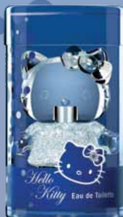
S 82057 Set Eau de toilette Hello Kitty Diamond contiene 18 mini eau de toilette 5 ml in confezione regalo trasparente, un tester da 50 ml, in espositore da banco 40 x 30 x 27 cm