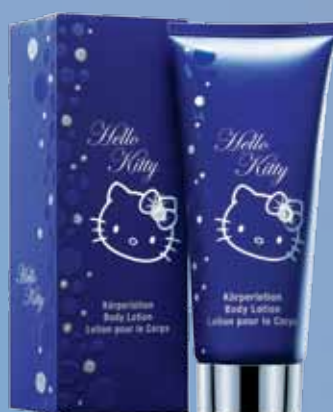
H 10502 Lozione corpo Hello Kitty Diamond in confezione regalo, 150 ml