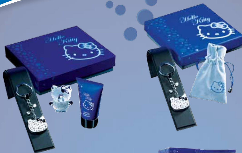
H 10510 Set regalo Hello Kitty Diamond contiene un eau de toilette 50ml, una lozione corpo 50ml e un portachiavi/moschettone con beauty lipgloss