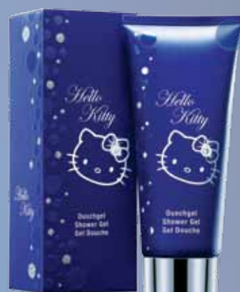
H 10500 Gel doccia Hello Kitty Diamond in confezione regalo, 150 ml