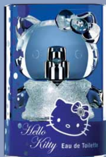
S 82056 Set Eau de toilette Hello Kitty Diamond contiene 4 eau de toilette 50 ml in confezione regalo trasparente e dei campioncini