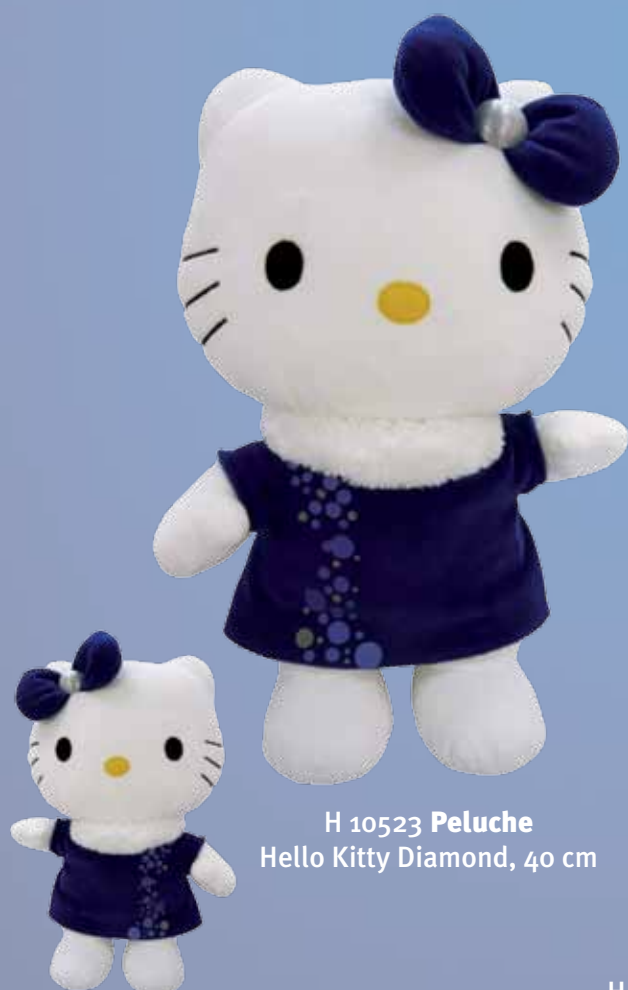
H 10523 Peluche Hello Kitty Diamond, 40 cm